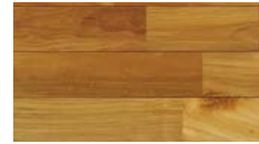
[ クリア ] PHFL0348