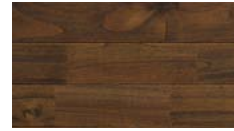
[ ブラック ] PHFL0349