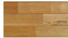
[ 無塗装 ] PHFL0352