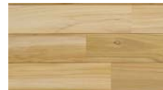
[ ホワイト ] PHFL0350