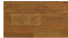
[ アンティーク ] PHFL0351